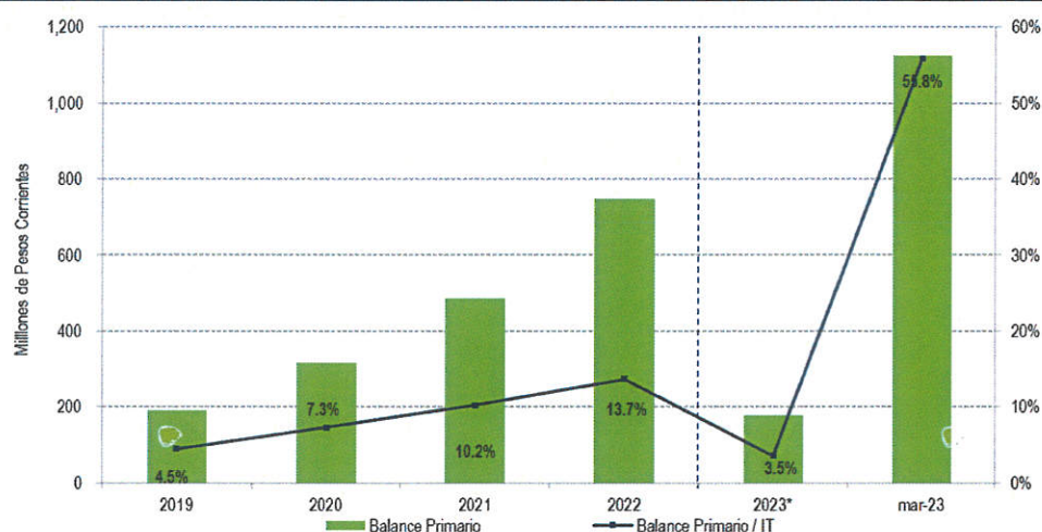
Figura 2. Balance Primario para el Municipio de Mexicali, de 2019 a marzo 2023